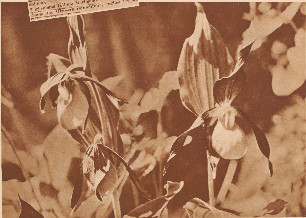
Unsere schönste Orchidee ist der Frauenschuh. Goldgelb leuchten seine Schüßlein mit den braunroten Laschen daran aus dem zartgrünen Laub.