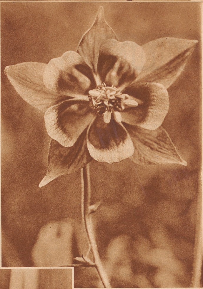
Kennt Ihr sie? Es ist die Akelei in ihrem braunroten Kleid! Aber diesmal von unten angeschaut!