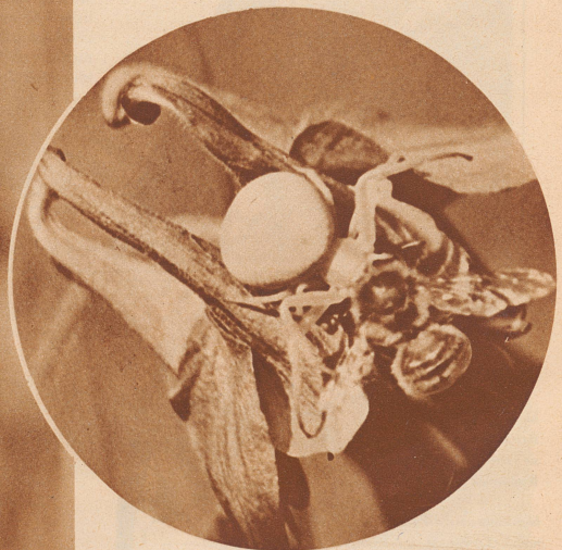
Tiertragödie! Soeben hat eine Grasspinne eine honigsuchende Biene überfallen; wenige Augenblicke später ist die Biene im Kampf unterlegen und wird nun von der Spinne ausgesogen.