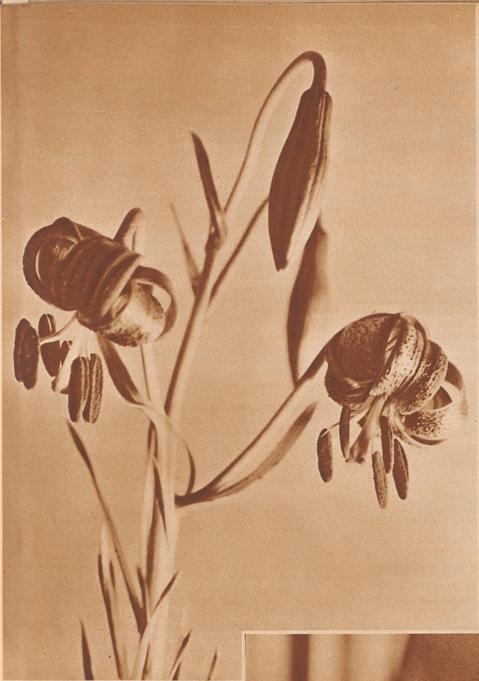
Ebenso gefährlich wie schön ist der Türkenbund, der ein ziemlich starkes Gift enthält. Weithin leuchten uns seine purpurnen Blüten entgegen!