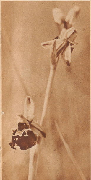
Der Hummel-Orchis ist einer der wenigen Vertreter der Insektenorchis-Arten unserer Heimat. Ihnen sollten wir unsern besonderen Schutz angedeihen lassen.

Ein eigenartiges Farbenspiel zeigt uns der purpurne Orchis. Seine Blüten, außen braunrot, sind innen weiß und so mit purpurroten Tupfen übersät, als ob ein Maler seinen Pinsel darüber ausgespritzt hätte.