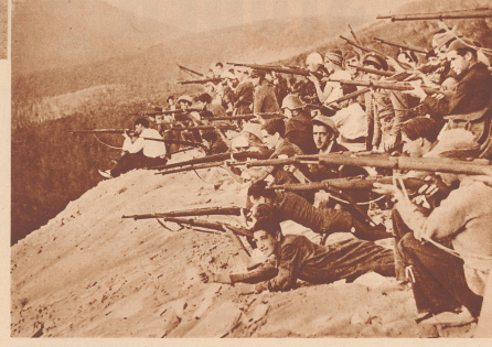
Unten: Freiwillige Militärsuppen der Regierung in Erwartung eines Sturmangriffes der Rebellen bei Guadarrama.

Auf ihrem Vormarsch von Norden auf die Hauptstadt und die revolutionären Truppen des Generali Mola in der Sierra de Guadarrama von den Regierungstruppen abgehalten werden... (An introductory paragraph about the Spanish Civil War.)