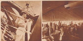
Ein Matrose des englischen Kreuzers »Kapelle«... Die Flüchtlinge aus Mallorca auf Deck des englischen Kreuzers »Kapelle«.