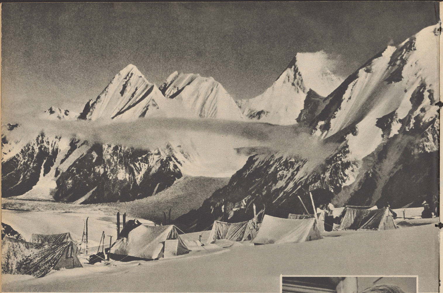
Lager 6 der Internationalen Himalaja-Expedition Professor Dr. G. O. Dyhrenfurths 1934 auf dem Conway-Sattel (6250 Meter über Meer). Im Hintergrund die Gasherbrum-Gruppe im Karakorum-Himalaja. Der Bericht über diese erfolgreiche Himalaja-Expedition erschien als Buch «Dämon Himalaja» im Verlag Benno Schwabe, Basel.