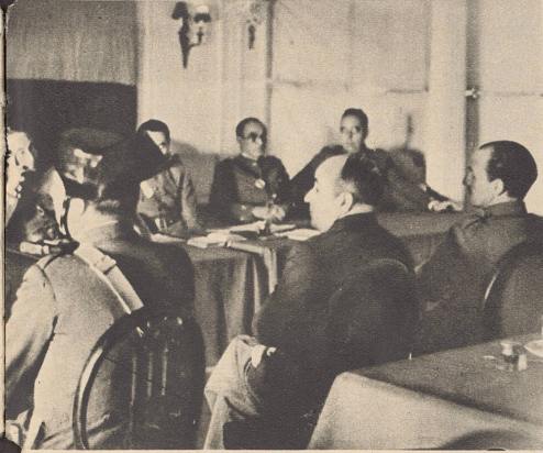
Die Generale Goded und Buriel, die vom Kriegsgericht in Barcelona zum Tode verurteilt und am 12. August im Festungsgraben des Forts von Montjuich erschossen wurden. Bild: Buriel (links in Zivilkleidern) und Goded (rechts in Uniform) vor dem Gerichtshof, unmittelbar vor der Verkündung des Todesurteiles.