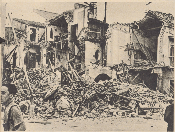
Wohnhäuser in Algeciras nach der Beschießung durch den regierungstreuen Kreuzer «Jaime I». Algeciras an der Südküste Spaniens, in der Nähe von Gibraltar, ist der Ort, wo General Franco seine afrikanischen Truppen landet.