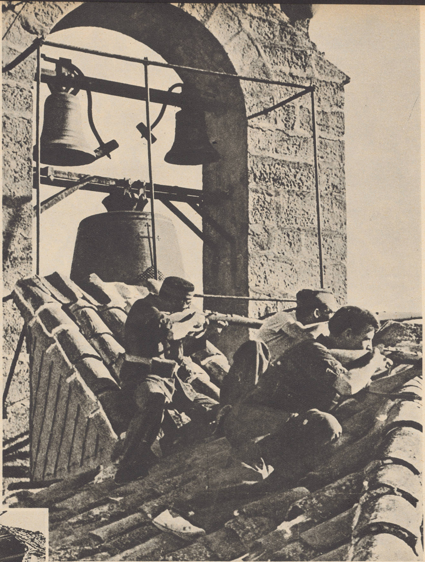
Im heftigen Kampf um den Besitz der Ortschaft Sigüenza, eines wichtigen strategischen Punktes an der Guadarrama-Front, beschießen die Regierungsmilizen vom Dache der Kirche aus die angreifenden aufständischen Truppen.