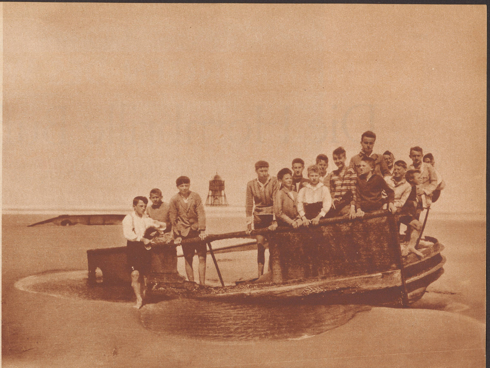
Die Ferienlager-Buben auf Süderoog haben bei Ebbe ein gestrandetes Wrack im Sande entdeckt. Sie lassen sich auf dem geheimnisvollen Boot fotografieren. Im Hintergrund sieht man eine Rettungsbarke. Das ist ein kleiner Unterkunftsraum mit Wasser und Proviant auf einem Balkengerüst. Es ist dazu bestimmt, die Besatzung von im Sturm gestrandeten Schiffen aufzunehmen.

Ein paar Tage später trug er Werners Ferienaufsatz in seiner Schulmappe nach Hause. Vielleicht bekam die Mutter dann mehr Kraft, wenn sie den Aufsatz las und die Bilder sah, die Werner noch dazu sauber ins Heft geklebt hatte. — Nun läßt euch Werner auch noch einen Blick in seine Ferienerinnerungen tun. Er ist Mitte Juli mit 14 anderen Schülern unter Leitung eines Geographie-Studenten von Zürich nach der Hallig Süderoog an der nordfriesischen Küste gereist. Das ist ein kleines Eiland,