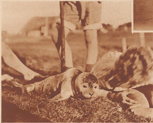
Sogar einen jungen Seehund haben die Zürcher Buben als seltenen Gast auf der kleinen Insel an der nordfriesischen Küste entdeckt.