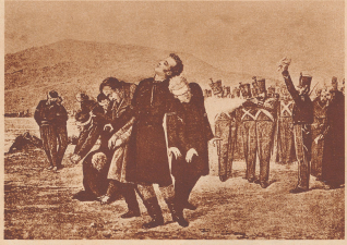
Nach Ferdinand VII. Tod (1808) erhoben sich die polnische Krone Spanien zwei Isabellen, die Cristina und die Isabella. Die Cristina setzte sich für die Konstitutionen, die für ihre unumgängliche Tochter Isabella die Regentschaft übernahm, und die Isabella kämpfte für die Thronfolge des Don Carlos, eines Bruders Ferdinands VII. Sie kam zu letzterem König.