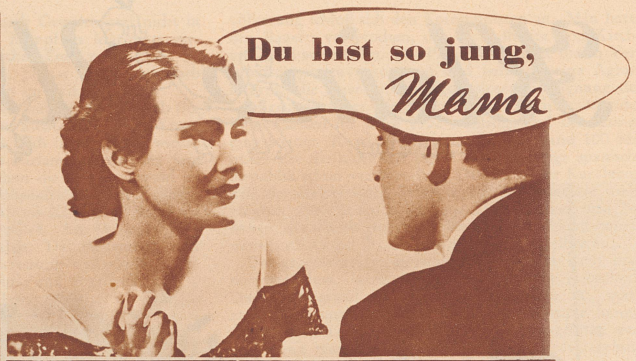
Sie scheint die Schwester ihres Sohnes zu sein

Einsenden an: V. Conzett & Huber, Generalvertretung für die Vita-Volks-Versicherung, Morgartenstraße 29, Zürich 4