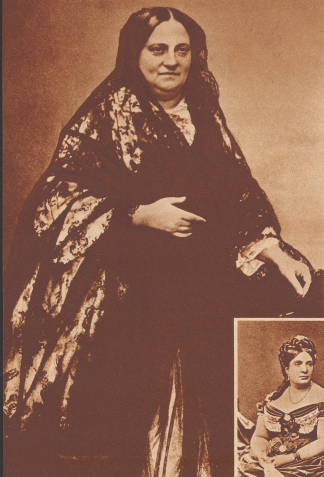
Königin Maria Christina, die Mutter Isabella II. (1816-1878). Sie war die Tochter Franz I., des Königs beider Sizilien und die verwitwete Königin Ferdinand VII. Sie veranlaßte ihren Mann, die absolute Erbfolgerechtsordnung durch die spanische Verfassung vom 19. März 1809 wieder herzustellen, nach der die Tochter zur Thronfolge berechtigt waren.