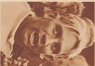
Jeff Scherens (Belgien) gewann zum fünftenmal die Pro- fessionell-Weltmeis- terschaft.