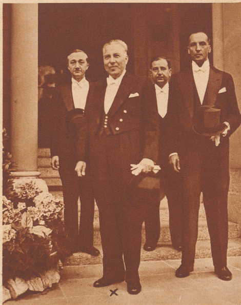
Minister Vasfi Mentès der neue türkische Gesandte in Bern.