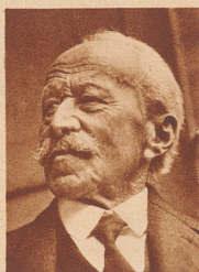
† Alt Turnlehrer Heinrich Ritter

früherer Zentralpräsident des Eidgenössischen Turnvereins, ein Pionier des schweizerischen Turnvereins, starb 84 Jahre alt in Zürich.