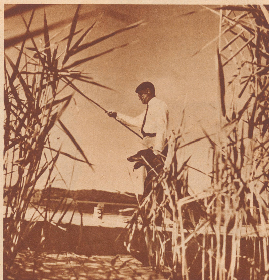
Das Fischen im Pfäffikersee ist dem seit Jahren in Paris lebenden Erfinder und Fabrikdirektor eine angenehme Ferienbeschäftigung.