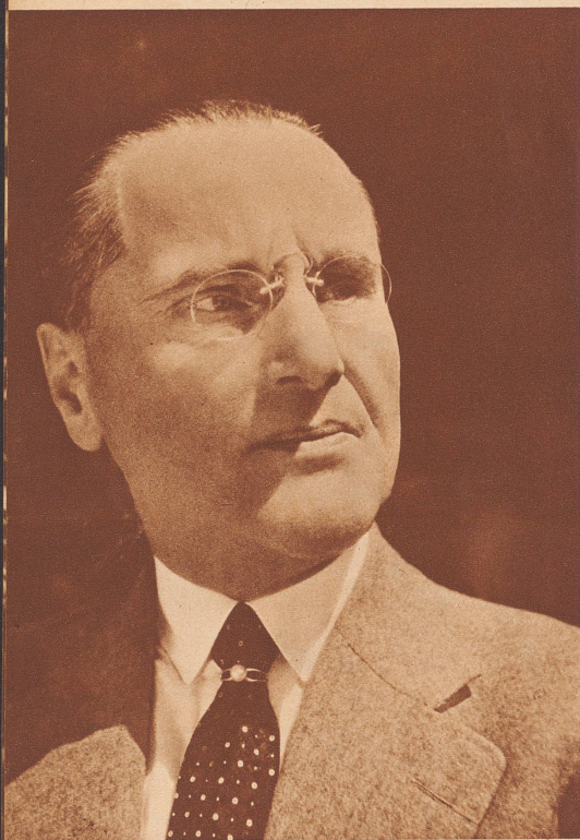
Dr. J. E. Brandenberger

der Erfinder des Cellophans. Unser Mitarbeiter besuchte ihn und ließ sich von ihm erzählen, wie er zu seiner Erfindung kam.