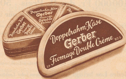
Schachtel 45 Rp.

bringt die Firma Gerber dem Feinschmecker wieder etwas Neues: