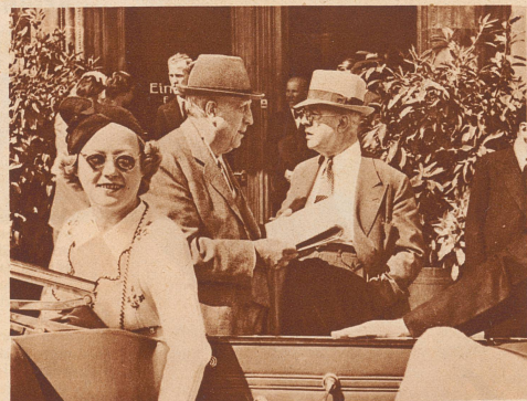
Der amerikanische Verleger und Zeitungskönig W. R. Hearst (mit der Autokarte in der Hand) und seine Frau, die Filmschauspielerin Marion Davies, vor dem Eingang zum Palace-Hotel in Davos. Die beiden berühmten und vielgenannten Herrschaften durchflogen — allerdings auf Pneus — auf ihrer Europareise in ein paar Tagen auch unser Land.

Vergangene Woche ist die jüngste Tochter des ehemaligen britischen Schatzkanzlers Sir Winston Churchill, Sarah, auf dem deutschen Dampfer «Bremen» nach Amerika durchgebrannt, wo sie in Chicago in einer Revue auftreten und nebenbei den österreichisch-amerikanischen Schauspieler Vic Oliver zu heiraten gedenkt. Beides gegen den Willen ihrer Eltern, die schon vor einem Jahr heftig, aber nutzlos protestierten, als Sarah zur Bühne ging. Oliver ist ein Komödientheater, den Miß Churchill kennenlernte, als sie vor einiger Zeit in Cochran's Revue «Follow the Sun» mitwirkte. Um die flüchtige Tochter einzufangen und sie von ihrem Schritt abzuhalten, hat sich ihr Bruder Randolph, der junge konservative Politiker, mit der «Queen Mary» zu ihrer Verfolgung aufgemacht. Da die «Bremen» aber einen Vorsprung von mehreren Stunden hat, wird Randolph Churchill bei seiner Ankunft in New York möglicherweise seine Schwester schon getraut vorfinden. Ganz England verfolgt mit großer Spannung die weiteren Etappen dieser Jagd. Die Angelegenheit beschäftigt im Augenblick das englische Publikum mehr als alle politischen Sensationen. Bild: Miß Sarah Churchill (Mitte) mit zwei Kolleginnen vom Theater.