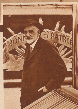
Das letzte Bild von Dr. Jean Baptiste Charcot, aufgenommen an Bord des «Pourquoi pas?» vor der Ausreise in Le Havre. Dr. Charcot war 70 Jahre alt, Großoffizier der Ehrenlegion und Besitzer zahlreicher Auszeichnungen internationaler gelehrter Gesellschaften.

Das Expeditionsschiff im Treibeis an der Südküste von Grönland. «Pourquoi pas?» war eine Dreimastbark von 450 Tonnen.