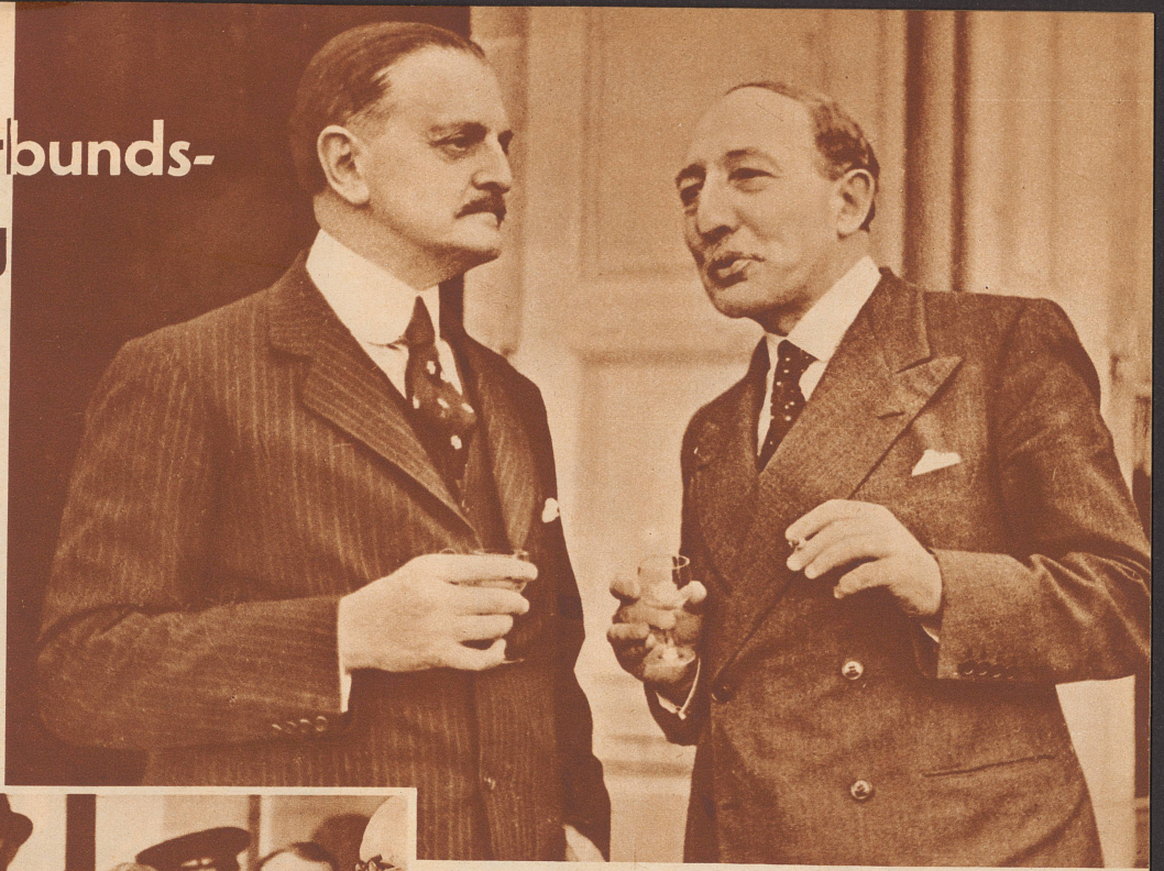
Zwei Prominente der Tagung

Zum ersten Male, seit der Völkerbund besteht, findet die ordentliche Versammlung dieses Jahr im neuen Völkerbundspalast statt. Auf der Tagesordnung stehen als Hauptbehandlungsgegenstände die Reform des Völkerbundes, die abessinische Frage und das Problem in Danzig.