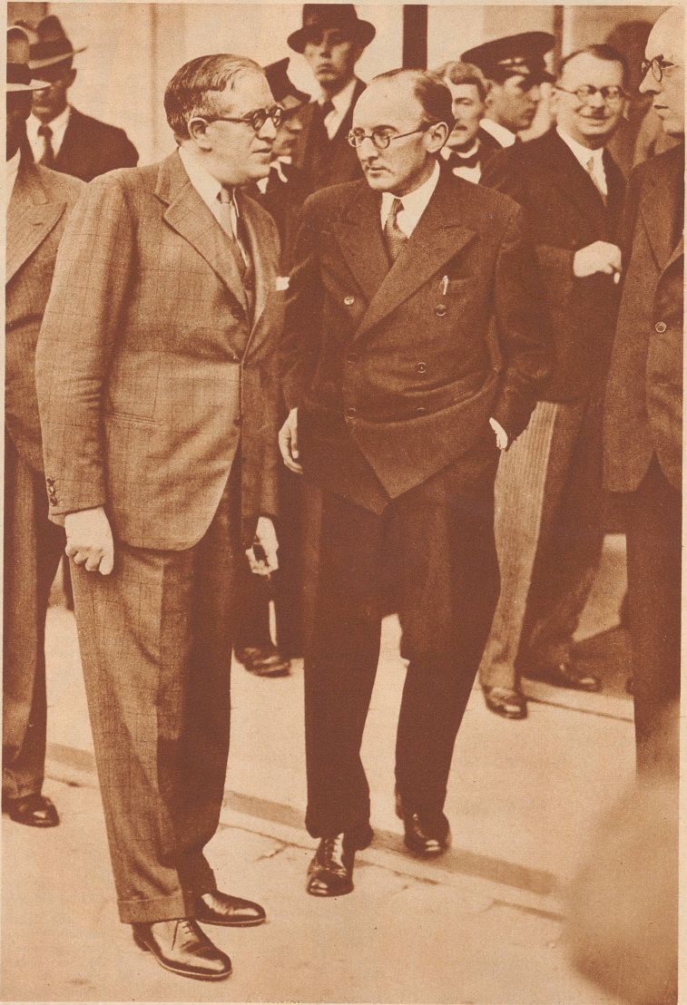
Alvarez Del Vayo

Dr. Saavedra Lamas (links), der argentinische Außenminister, der Präsident der 17. Völkerbundsversammlung, im Gespräch mit Yvon Delbos, dem französischen Außenminister. Saavedra Lamas ist einer der einflussreichsten Staatsmänner Südamerikas und überzeugter Anhänger des Völkerbundes. Delbos ist eine ganz große Figur im gegenwärtigen französischen Kabinett Blum.