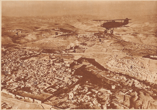
Blick auf Jerusalem und die unmittelbare Umgehung. Was innerhalb der Ringmauern, zum Teil sehr kompakt zusammengelagert, zu sehen ist, ist die Altstadt. Sie ist eingeteilt in das Judenviertel I, das Mohammedanerviertel II, das Christenviertel III und das türkische Viertel IV. Im Hintergrund sehen wir die kalte Landschaft heraus: die Hebräische Universität, die Kaiserin-Augusta-Viktoria-Straße, das Karawanserai, das Grab-Gebäude, das Dorf Silos und die jüdische Kolonie, die der Matzlen und die Grab-David-Kirche, 7 der Felder, Hildisch Chovraschaker genannt. Er steht auf dem alten Tempelplatz, der ein viertes Viertel der Altstadt einnimmt. Dieser Platz ist seit der Zerstörung Jerusalems durch Tyus unbenutzt geblieben. Das Palastmauerwerk - ein ständiger Ausbau - ist nicht mehr die heilige Seite der Mohammedaner.

Die Gegensätze in Palästina spitzen sich zu. Es scheint, daß die Araber fest entschlossen sind, den Kampf gegen die Mandatsmacht auf der ganzen Linie und mit allen Mitteln aufzunehmen. Überfälle auf englische Soldaten, Brandstiftungen und Bombenwürfe sind an der Tagesordnung, und die Antizitate auf die Erdölförderung, die Palästina durchquert, mehren sich. Nach einer offiziellen englischen Verlustliste sind seit Beginn des Kleinrieges in Palästina 261 Personen ums Leben gekommen, darunter 167 Araber, 79 Juden, 15 englische Soldaten. England verstärkte in den drei letzten Wochen die Besatzungsmarine um eine ganze Division. Es sieht im Augenblick so aus, wie wenn es beide Parteien auf eine Machtprobe ankommen lassen wollten.