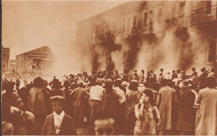
Feuer in Tel Aviv. Am 23. September traf der Dampfer «Laurentica» mit dem ersten 1420 Mann zählenden Kontingente der englischen Vorkriegstruppen in Haifa ein. An diesem Tage kam es in ganz Palästina, als Zeichen des arabischen Protestes, zu schweren Ausschreitungen. In Jerusalem kamen bei einer Bombenexplosion drei Menschen ums Leben, in Tel Aviv zündeten die Araber gleichsam ein ganzes Quartier in Brand.

Die Gegensätze in Palästina spitzen sich zu. Es scheint, daß die Araber fest entschlossen sind, den Kampf gegen die Mandatsmacht auf der ganzen Linie und mit allen Mitteln aufzunehmen. Überfälle auf englische Soldaten, Brandstiftungen und Bombenwürfe sind an der Tagesordnung, und die Antizitate auf die Erdölförderung, die Palästina durchquert, mehren sich. Nach einer offiziellen englischen Verlustliste sind seit Beginn des Kleinrieges in Palästina 261 Personen ums Leben gekommen, darunter 167 Araber, 79 Juden, 15 englische Soldaten. England verstärkte in den drei letzten Wochen die Besatzungsmarine um eine ganze Division. Es sieht im Augenblick so aus, wie wenn es beide Parteien auf eine Machtprobe ankommen lassen wollten.