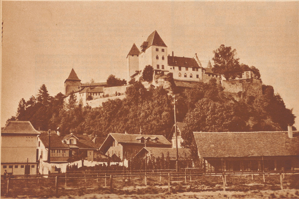
Schloß Burgdorf von Süden gesehen.

Erscheinen zwanglos in der «Zürcher Illustrierten» + Alle für die Redaktion bestimmten Sendungen sind zu richten an die «Geschäftsstelle des Wanderbunds», Zürich 4, am Hallwylplatz