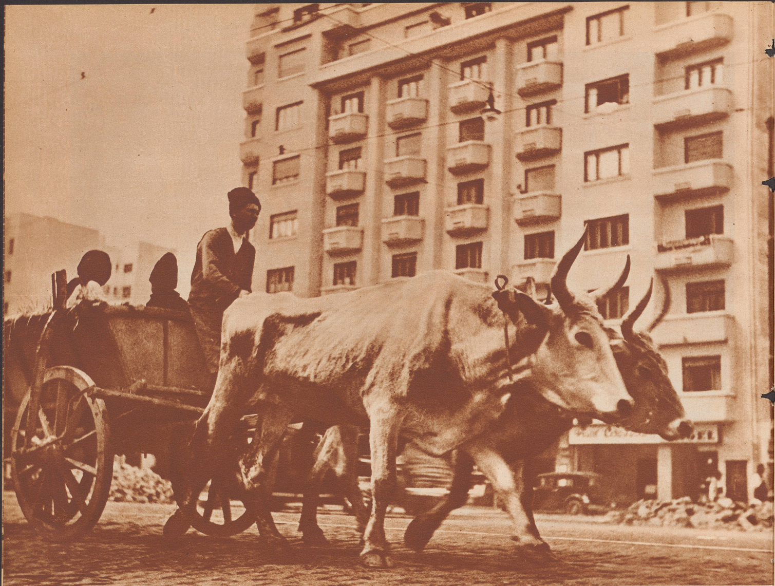
Von den Dörfern der Umgebung bringen die Bauern zumeist selber die Erzeugnisse eines fruchtbaren Bodens in die Hauptstadt. So sieht man denn jeden Morgen schwerfällige Ochsespanne vor nicht minder schwerfälligen Bennewagen gemächlichen Schrittes der Piata Mare (großer Platz), dem Bukarester Zentralmarkt zutrotten.