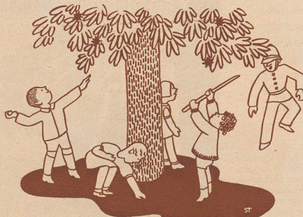
Polizist: «Heda, Bürschtl, säb ich de verbote, 's Chaschtanie abeschla!»