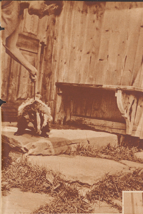
Der Dachs ist sonst ein scheues Tier, das man nicht in Gefangenschaft halten kann. Dennoch leistete uns ein zugelaufener Dachs einige Zeit als zutraulicher Feriengast im Appenzellerland Gesellschaft.