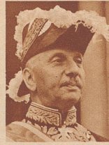
Minister Konstantin Psaroudas der neue griechische Gesandte in Bern. Minister Psaroudas war zuletzt griechischer Gesandter in Moskau.

Die beiden Berner Sportflieger Hans Lauri (links) und Ernst Moret (rechts), die am 6. Oktober anlässlich des großen Staffelfluges der Schweizer Sportflieger nach Berlin bei Auma im Thüringerwald tödlich abstürzten.