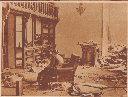
Traurige Rückkehr. So verwüstet fand diese Frau ihre Wohnung vor, als sie nach dem Abzug der Miliztruppen in ihre Heimat Toledo zurückkehren konnte.