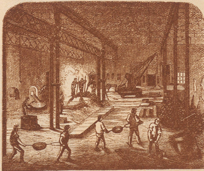
So sah es im Innern der Kanonengießerei in Woolwich vor ungefähr hundert Jahren aus.