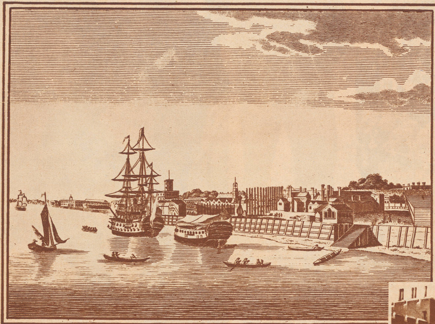
Woolwich, am rechten Themseufer gelegen, wie es aussah, als die dort gegründete Waffenindustrie noch jung war. Heute ist Woolwich, ganz von der Riesenstadt London aufgeschluckt, ein Vorort mit 150 000 Einwohnern, mit Waffenarsenalen und der bekannten Militärakademie.