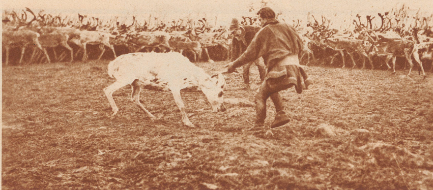
Ein störrisches Albino-Renntier wird zur Scheidung eingefangen.

Es war so, die leeren Fässer, die für das Öl bestimmt waren, wurden von dem Wasser gegen das Dach des Laderaums gedrückt und wirkten wie viele Bojenschwimmer — der Schoner konnte nicht tiefer sinken. Eine