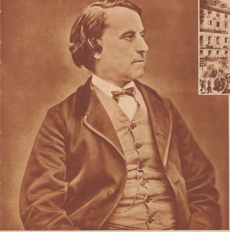
Louis Blanc (1811-1882) war Mitglied der Revolutionsregierung 1848. Er gilt als der erste volkswirtschaftlich gedachte Staatsmann überhaupt. Seine Lehren und vom Teil für die sozialistische Denkweise heute noch gültig. Er gründete die nationale Werkstätte für die Arbeiter, deren empfindliche Schließung dazu zu den Ursachen im Juni 1848 führte. Blanc, wurde dann vollständig nach England flohen, gilt aber später wiederholt noch in die politischen Ereignisse ein.