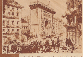
Am 23. Juni 1848 begann in Paris infolge der arbeitervirtschaftlichen Forderungen von Lamartine Blanc »partageux«. Die brutale Reaktionäre Cavagnac warf den Aufstand nieder. Die Gegend wurde durch die überwiegende Eskalation verdrängt. Einige Führer der Februarrevolution, wie z. B. Louis Blanc, flohen nach England. Bild: Der Sozialist Cavagnac am Tor von St. Denis in Paris.