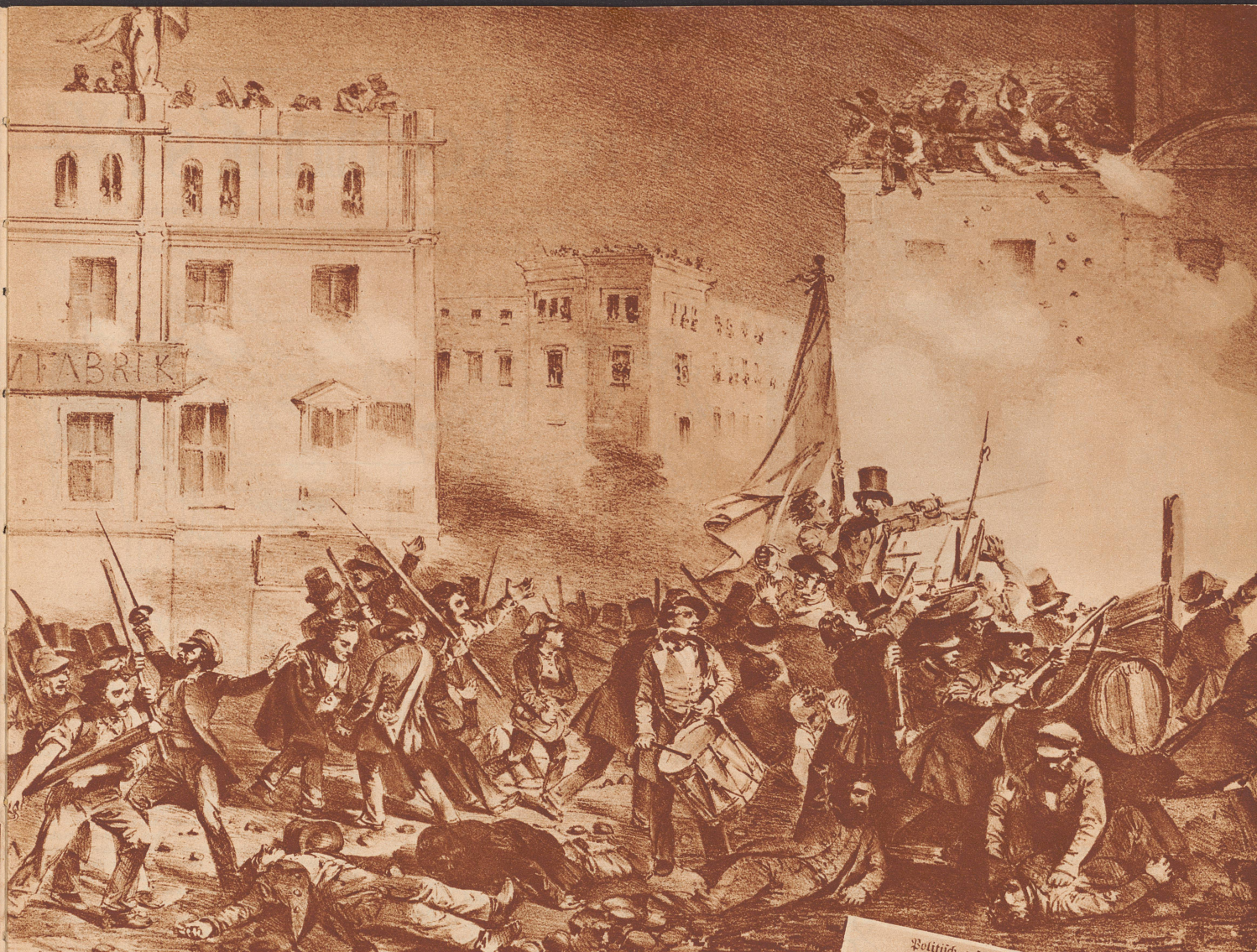
Barrikadenkampf an der Ecke Roß- und Gertraudenstraße in Berlin am 18. März 1848. Une barricade à l'angle des Ross- et Gertraudenstraße à Berlin, le 18 mars 1848.

Lithographie von Elsholtz