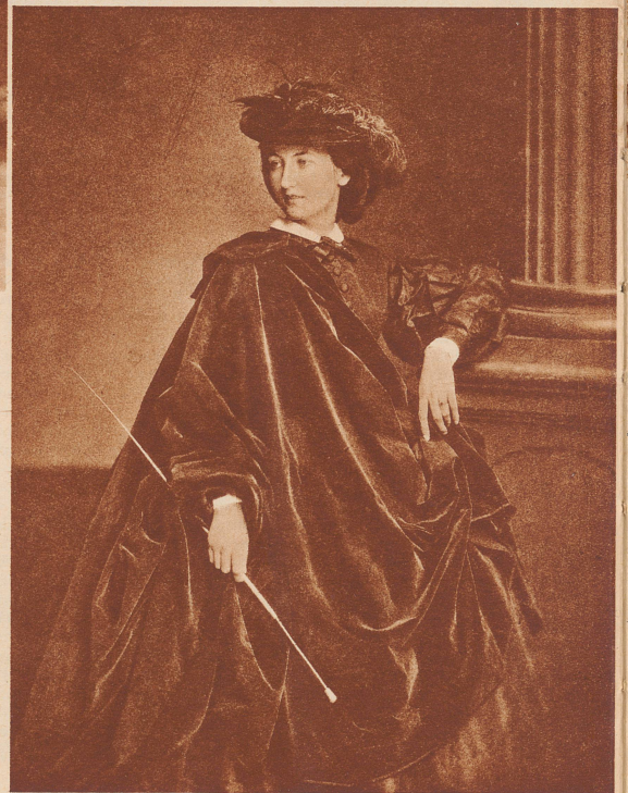
Die Tänzerin Lola Montez war ihrer Liebeshändel wegen berüchtigt, schon ehe sie 1846 in München auftauchte. Hier bestrickte sie den König Ludwig I. von Bayern und benahm sich dermaßen skandalös und herrschsüchtig, daß der König sich zur Abdankung gezwungen sah.

En Allemagne aussi, le système de Metternich ne tient plus que comme un château de cartes. Frédéric-Guillaume IV règne sur la Prusse depuis 1840. Ce souverain, irrésolu et imbu de romantisme, ne se croit guère moins que le représentant de Dieu sur la terre. Les révolutions qui, en 1848, éclatent à Bade, à Wurtemberg, en Bavière, en Hanovre, Saxe, Thuringe, ne cessent de l'inquiéter. Il croit bien faire de promettre à «ses bien-aimés Berlinois» une constitution. Mais comme il tarde à le faire, la révolution gagne Berlin. Le 5 décembre 1848, le monarque se verra contraint de doter son pays d'une constitution... qu'il s'empressera de modifier par la suite. 1848 marque la fin d'un système politique qui fit ses preuves des siècles durant: la monarchie absolue, et dans les républiques: l'oligarchie du patriciat.