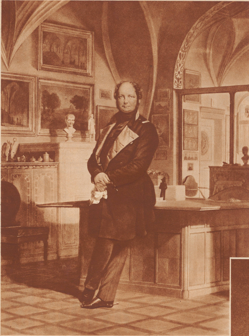
Friedrich Wilhelm IV. (1795-1861), König von Preußen. Er war ein Schwärmer auf dem Thron, glaubte an das Gottesgnadentum seiner königlichen Würde und träumte davon, Volksbeglickter zu sein. Seine «lieben Berliner» liebten sich von seinen Kundgebungen eine Weile betören, sahen sich dann aber schließlich bitter enttäuscht.