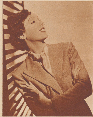
Das Sportgirl – im klassischen Tailleur – als zeitgemäßer Jungmädchentyp.

Le costume tailleur standard des sportives.