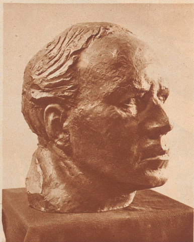
GEORG KOLBE: Selbstbildnis.

Une exposition de sculpteurs allemands au «Kunsthhaus» de Zurich.