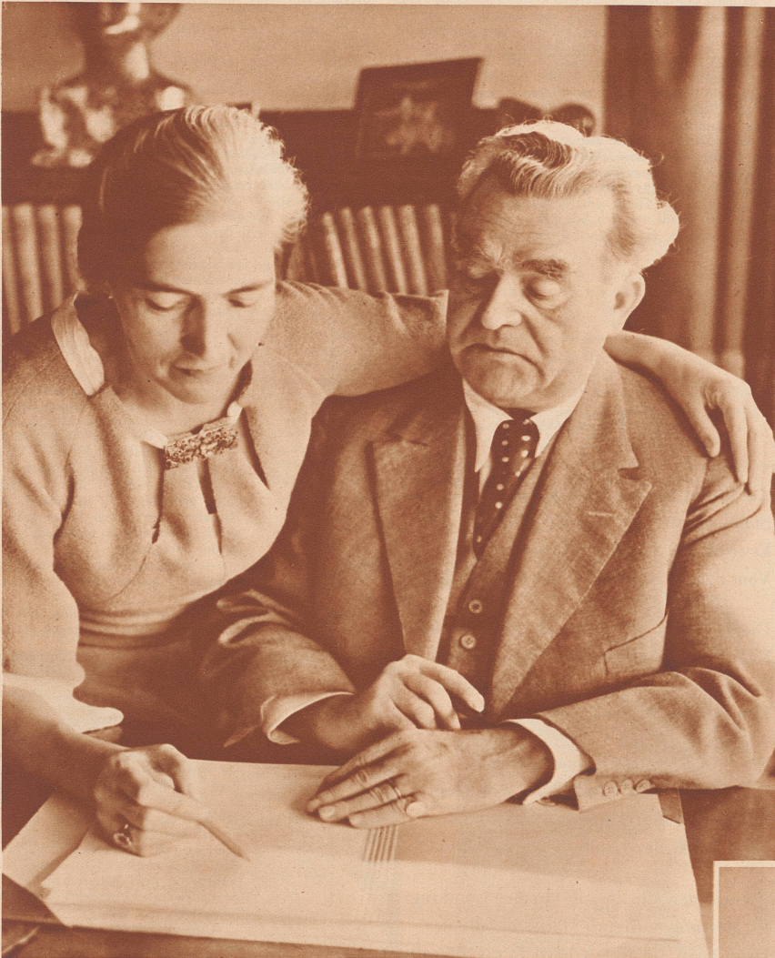
Der Dichter mit seiner Gattin am Schreibtisch seiner Wohnung in Erlenbach. L'écrivain et sa femme dans leur demeure d'Erlenbach.