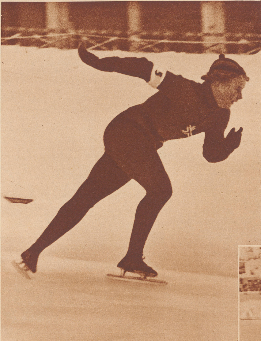
Frl. Laila Schou-Nilsen (Norwegen) stellt neue Weltrekorde im 500-, 1000- und 3000-Meter-Lauf auf und placiert sich mit 207,563 Punkten in der Gesamtwertung an 1. Stelle.

Melle Laila Schou-Nilsen (Norvège) établit trois nouveaux records féminins du monde dans les 500, 1000 et 3000 mètres et se place en 1 er rang du classement combiné avec 207,563 points.