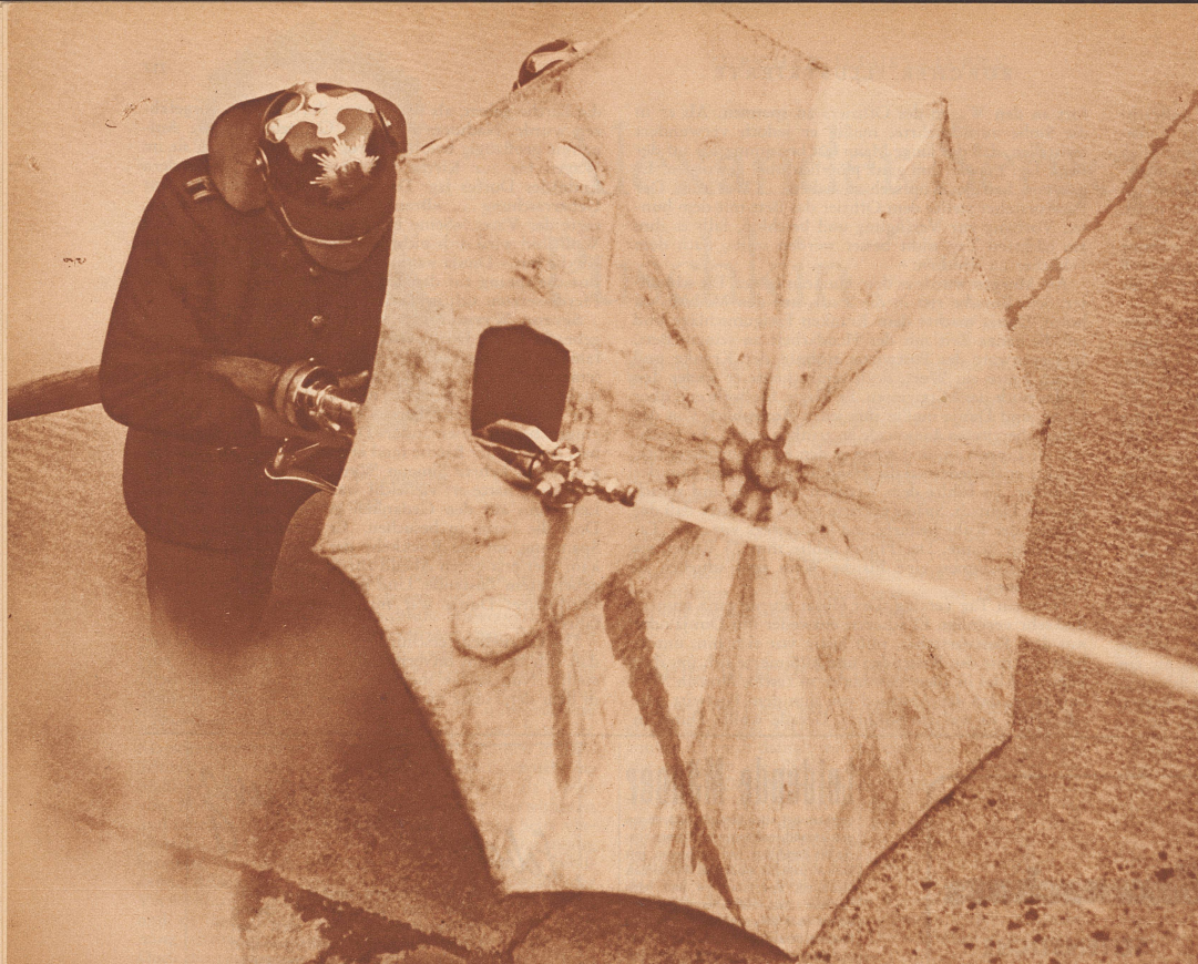
Der Asbestschirm gestattet den Feuerwehrmännern, dem Feuer nahe auf den Leib zu rücken. Asbest ist unverbrennbar und läßt die Hitze nicht durch.