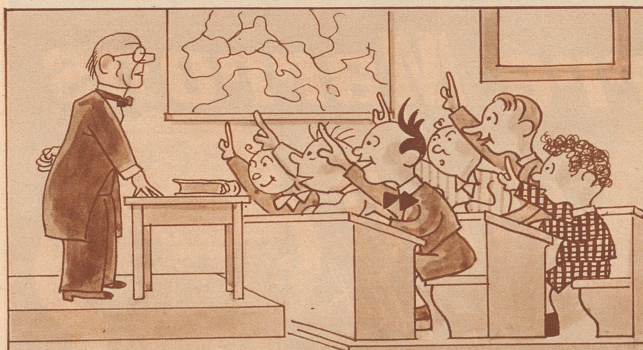
Der Lehrer, welcher vorne stand, Sah nie des kleinen Fritzlis Hand, Die dieser, wenn er etwas wußte, Ihm stets entgegenstrecken mußte.