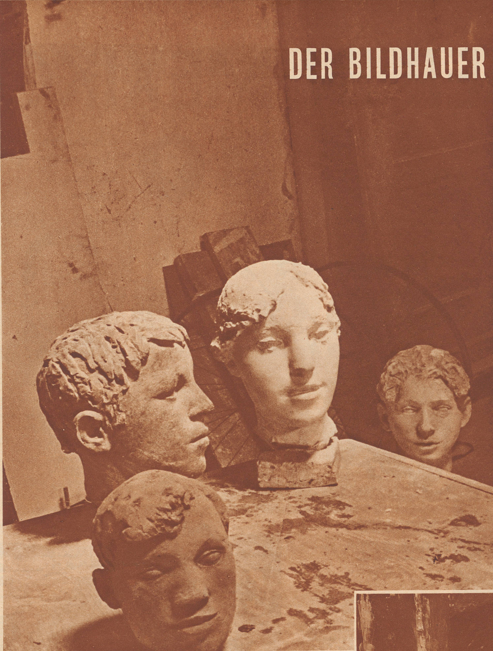
Vier Köpfe aus Geisers Atelier.

Ein Berner, in Zürich lebend, heute etwa dreißigjährig, der schon als Schüler des Gymnasiums modellierte und gleich nach der Matura die mütterliche Küche bös mit Gips verschmutzte, weil er die Abgüsse für den Fünfliberwettbewerb eben da anfertigte. Er hat von großen Vorbildern gelernt, in Museen, vor allem in Paris und vor allem von der Antike, im übrigen ist er Autodidakt.