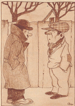
Serenade einst . . . . . und jetzt Sérénade jadis . . . . . aujourd'hui

«Los Heiri, häsch du e kein alte Ueberzieher für mich?» «Woll, aber er wird d'r z'wyt si!» «Jä woher, ganz sicher nöd!» «Dann chasch en ja hole, er isch z'Genf une!» «Bisch verruckt – ich cha doch nöd uf Genf abe reise wäge me-n-alte Ueberzieher!» «Ich ha d'r's ja grad gseit, er wird d'r z'wyt si!»