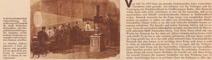
In der französischen Nachkriegsberatung: Verhandlung und Entschluß der durch Besatzung überbrachten Verhandlungen. Die Doppeldecker werden durch die Zerstörungen zerstört und von besetzten Kanonen zerstört. Les députés chagrins parvenant à Paris par chemin de fer, ils se réunirent dans un appartement de la rue de Valenciennes.