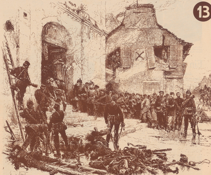
Aus dem Bericht des Generalen Ducrot über die Verteidigung von Paris: «Das Dorf Le Bourget, überschritten von Gensaten und von einer ganzen preussischen Gendarmenbrigade überfallen, geriet in Feindschaft (15. Oktober 1870). Alles schwebte im Trübe, aber in der Dürftigkeit versuchten sich die französischen Offiziere und wussten weitere Missetaten zu verhindern. Man mußte sie durch die Häuser niederstrecken und eine Kanone herbeiholen, um den Rest dieser tapferen Schar zur Ergreifung zu zwingen.» «Le Bourget, criblé d'éclats et assailli par toute une division de la garde prussienne, venait de tomber au pouvoir de l'ennemi. Tous soldats fusés, dans l'ignominie, sans officiers français et sans vivres, les défenseurs résistèrent encore. Ils se défendirent jusqu'à la dernière extrémité, et il fallut les tuer par les fenêtres et amener du canon pour forcer à se rendre les débris de cette brave troupe...» (General Ducrot (La défense de Paris. Discours d'Alphonse de Noailles).)