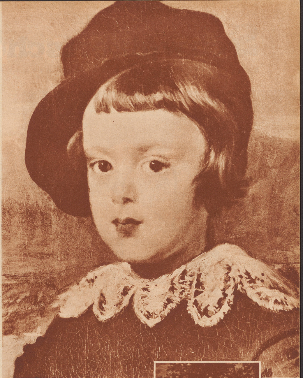
Ausschnitt aus dem rechts unten stehenden Gemälde «Erbprinz Don Baltasar Carlos» Détail du portrait de l'Infant Don Baltasar Carlos.