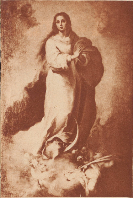
Bartolomé Estébon Murillo (1617–1682).

Die unbefleckte Empfängnis. Von lichtblauem Mantel umflossen schwebt die helle mädchenhafte Madonna auf Wolken, mit dem Fuß auf der Mondsichel. Lustige Engel mit Lilien, Palmen und der Weltkugel als Symbole der Reinheit, des göttlichen Opfers und der Herrschaft, umspielen das zarte Wesen mit dem himmelgewandten Blick. Diese graziöse Schöpfung gehörte zu den beliebtesten Bildern des Prado.