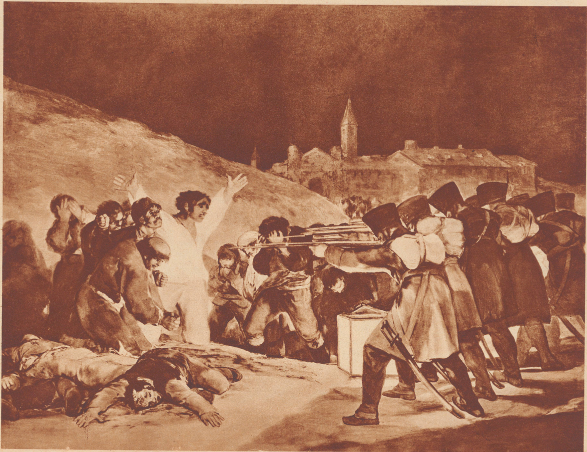
Francisco de Goya (1746—1828)

sah in seinem langen 82jährigen Leben gleichsam zwei Welten: eine luxuriöse Zeit, in der er als kräftiger Emporkömmling, großer Abenteurer, Stierkämpfer, Liebes- und Messerheld eine Rolle spielte und hernach eine Folge von Kämpfen, die er in dem bekannten tieftraurigen Zyklus von Radierungen «Desastres de la Guerra» - Schrecken des Krieges - geschildert hat. Bild: Der dritte Mai. Soldaten Napoleons erschließen aufständische Madrider. Exekutionen wie heute! Und zu denken, daß heute wiederum von fremden Flugzeugen abgeworfene Bomben eben diese Darstellungen alter Grausamkeiten und Metzelen gefährden und zu zerstören drohen. Die Welt lernt nichts, gar nichts aus dem Vergangenen.