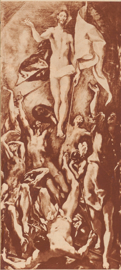
El Greco (1547–1614)

Bartolomé Estébon Murillo (1617–1682): L'Immaculée Conception.