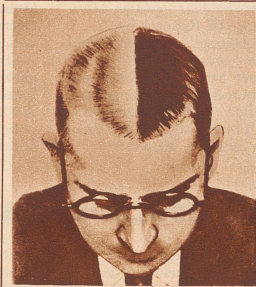
In dem hier beschriebenen Experiment wurde das Haar kurz geschritten und in der Mitte ein Streifen ausrasiert. Während fünf Wochen wurde Silvikrin nur auf der linken Seite verwendet. Das Bild zeigt das Resultat: Zunahme des Haarwuchses um 35 Prozent.

Und nun das Resultat: Nach einer Behandlung von fünf Wochen waren die Haare auf der behandelten Kopfhälfte um durchschnittlich 35% stärker gewachsen als auf der nicht behandelten Seite. Der Arzt war überzeugt. Der Versuch war glänzend gelungen. Das Präparat war Silvikrin.