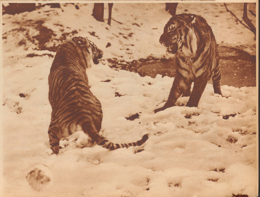
Tiger im Londoner Zoo nach einer Schneefall-Nacht. Tigres au jardin zoologique de Londres.