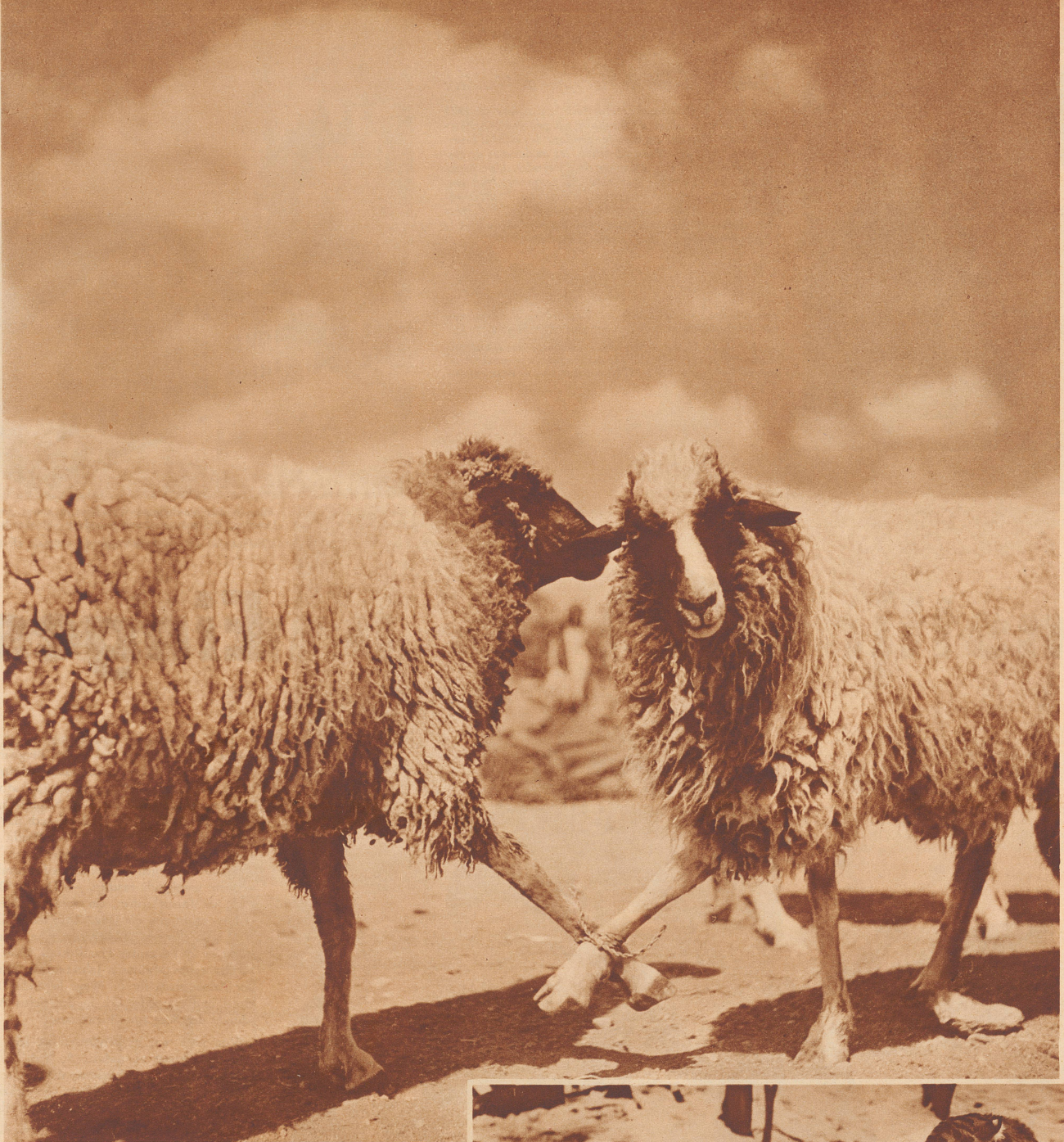
Schafe auf dem Markt bei Marrakesch. Moutons au marché de Marrakech.