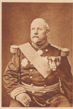
General Vinoy, der die Erstürmung von Paris durchführte, war ein Gegner der Revolution.

Die ersten Schritte nach Gambetta traten zurück, Paris kapitulierte. Die Regierung der Nationalversammlung (Assemblée nationale) wurde durch die Nationalversammlung ersetzt. Die Regierung der Nationalversammlung wurde durch die Nationalversammlung ersetzt.