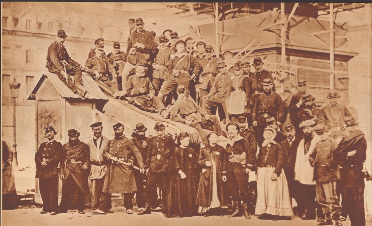
Vor der gefälligen Vendôme-Säule ließen sich die Truppen der Kommune mit Vorliebe photographieren. Nur wenige der auf dem Bild sichtbaren Leute überlebten die abtunige Woche, die bald kommen sollte. Pour perler la mémoire de leur «étrange exploit», les troupes de la Commune se font photographier sur les débris de la colonne Vendôme.