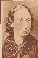
Louise Michel, die die «violette rouge», commanda le

Louis Michel, genannt die «rose Juifras». Im frühen Jugendalter besaß er die nachfolgende Kind eines französischen Aristokraten, sozialistische Propaganda zu machen. Während der Kommune führte er die Frauenkollonne, die sich während der Straßenkämpfe in der «blauen» Woche durch Tapferkeit hervortat. Sie wurde nach dem Zusammenbruch der Kommune in die Straßenschlacht weichen.