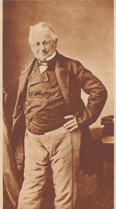
General Vinoy, der die Erstürmung von Paris durchführte, war ein Gegner der Revolution.