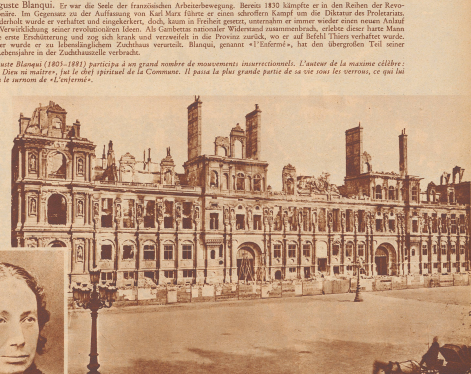
Das von den Communards zerstörte Pariser Rathaus. Les déprédations commises à l'Hôtel de ville de Paris par les communards.