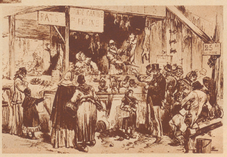
Handensgerötter in Paris während der Belagerung durch die Deutschen. Die Hungernot war damals so groß, daß von dem ausgehungerten Kanarienvogel schon Käse gegessen wurde.