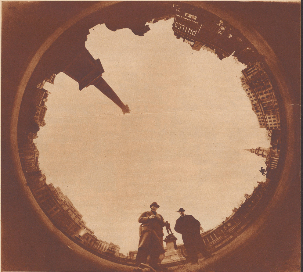
Eine Rund-Photographie, mit der Wunderkamera des Cambridger Gelehrten Mr. Hill aufgenommen.