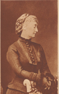
Kaiserin Eugénie im Exil. Ihre polnische Rolle war mit dem Tode ihres Sohnes (1. Juni 1879) ausgeglichen. Sie lebte als Gräfin Terzinski sehr zurückgezogen bis zu ihrem am 10. Juli 1920 erfolgigen Tode.