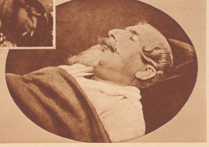
Napoleon III. auf dem Totenbett.

Der deutsch-französische Krieg führte jenseits des kriegsreichen Geschichte große Empfindungen herbei. Er setzte dem zweiten französischen Kaiserreich ein Schlußfeld und es beschleunigte die Verwirklichung des von Bismarck längt mit staatsmännlicher Umsicht vorbereiteten Planes eines deutschen Kaiserreiches. Napoleon III. war krank, von Enttäuschungen zermürbt, und so brachte ihm die Niederlage von Sedan statt Bitterkeit eher Entspannung und Erlösung von einer Last, die ihm vorher schon von seinen eigenen Gattin, der einzigen Logen, langsam aus der Hand gekommen