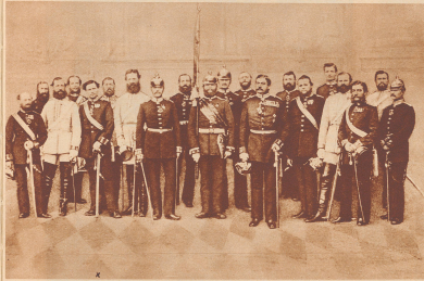
Die Abordnung des Gardekorps bei der Kaiserproklamation in Versailles. Das Bild ist deswegen beschnitten, weil der dritte von links in der vorderen Reihe Leutnant Hindenburg ist, der spätere Feldmarschall. La délégation de la Garde de corps à la proclamation de Versailles. Le troisième officier de gauche est le Lt v. Hindenburg qui devint plus tard Maréchal d'Empire.