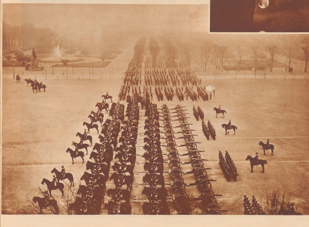
Die deutschen Truppen in Paris.