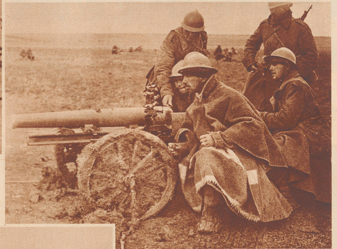
Kampf in Dreck und Schlamm. Tankabwehrgeschütz der Franco-Truppen in Stellung vor Brihuega. Sous la pluie et dans la boue. Un canon anti-tank des troupes de Franco en position devant Brihuega.