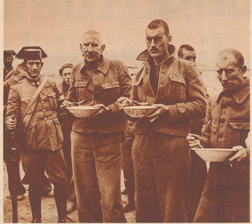
Die ersten englischen Kriegsgefangenen. Drei von 25 englischen Kriegsfreiwilligen, die in der Schlacht von Guadalajara auf Seite der Regierungstruppen in der internationalen Brigade mitkämpften und von den Aufständischen gefangen genommen wurden. Trois volontaires anglais — des 25 qui combattent dans les rangs de la brigade internationale — viennent d'être prisonniers par les Nationaux.