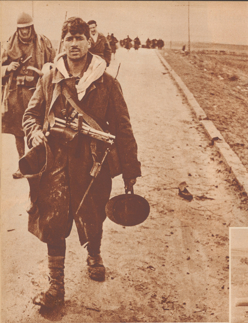
Soldaten der Nationalisten auf dem Rückzug von der Front bei Guadalajara, wo sie fünf Tage ununterbrochen im Feuer gestanden haben. Après avoir subi, cinq jours durant, un feu meurtrier dans le secteur de Guadalajara, les Nationaux sont obligés de se replier.