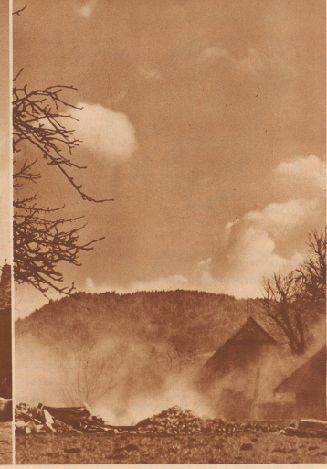
10 Uhr 50 Minuten 2 1/2 Sekunden:

Eine halbe Sekunde später ist die alte Bauwerk weiter gebrochen. Es ist nur noch halb so hoch wie zuvor, und bald wird es sich in seiner ganzen Länge auf die Seite geworfen haben.