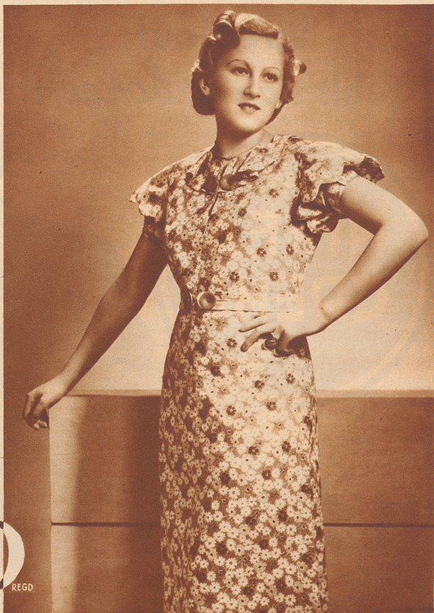
Fertiges Kleid aus Tobralco, Modell „Rosemie“, Marke „Scherrer“.

Fertige Kleider aus Tobralco tragen ausschließlich die Marke „SCHERRER“ — Kinderkleider die Marke „HAURY“.