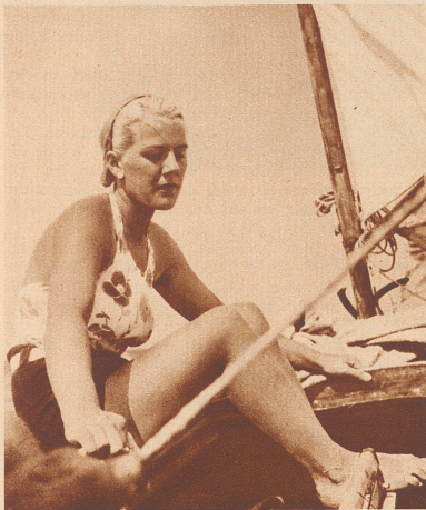
Blonde Paduanerin beim Segeln. Une blonde Padouanne dans un bateau à voile.