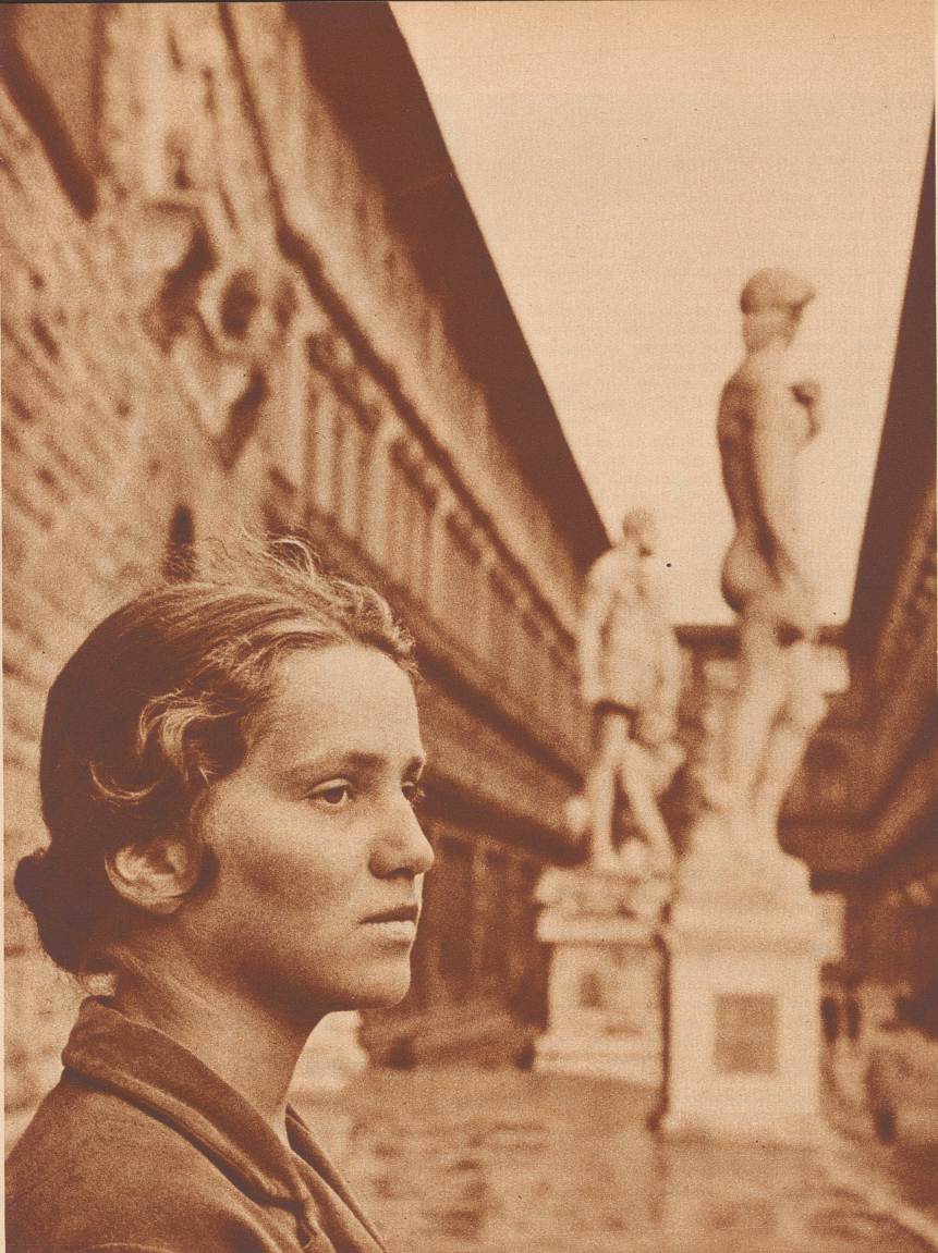
Deutsches Wandermädchen vor dem Uffizienpalast in Florenz. Une Allemande aux taches de rousseur sur la place des Of- fices, à Florence.