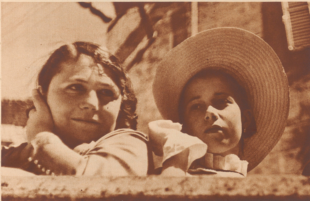
In San Marino. Man feiert das Fest des heiligen Marinus. Zwei Zuschaue- rinnen an der Brüstung der Straße. Deux spectatrices de la fête pa- tronale de St-Marin.