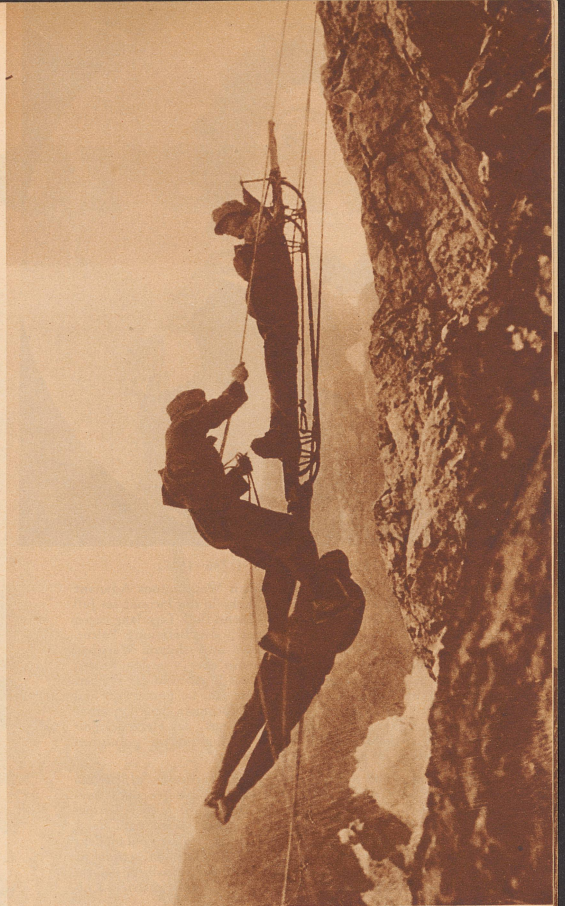
Ein gefährlicher Transport.

Am Kreuzstock, in der Nähe von Garmisch-Partenkirchen, fanden kürzlich militärische Uebungen statt. Dabei mußte die Sanität einen «schwerverwundeten» Soldaten über eine senkrecht abfallende Felswand transportieren. Die Tragbahre war aus Skiern zusammengesetzt. Das Bild zeigt euch die mutigen Männer, wie sie den Verwundeten an Seilen in die schauerliche Tiefe hinunterlassen.