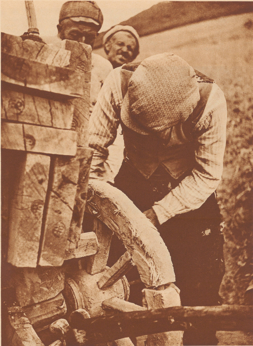
Ein Bauernkarren aus Anatolien, dessen Räder unbereift sind.