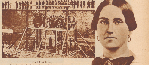
Die Hinrichtung der vier Komplizen Booths, der Lincoln ermordete. Die Hinrichtung fand am die Hinrichtung der vier Komplizen Booths, der Lincoln ermordete.