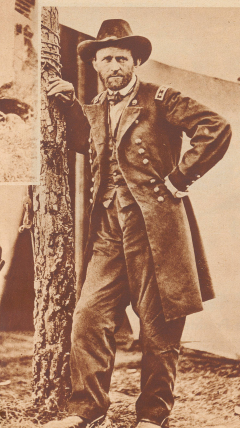
General Ulysses Grant in deren Hände Anfang 1864 die Lincolns, der gemessen Sonderbund der Nordarmee gelegt wurde. General Ulysses Grant empfing die Lincolns, der gemessen Sonderbund der Nordarmee gelegt wurde.