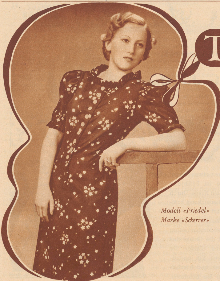
Modell «Friedel» Marke «Scherrer»

22) Der schwarze König kann nicht mehr zur Bauernlinie eindringen und Dr. Tartakower mußte nach einem zähe geführten Kampf die Waffen strecken.