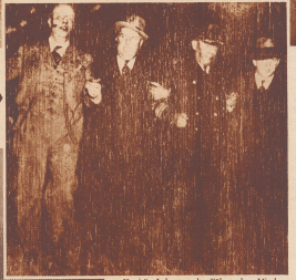
Kapitän Lehmann, der Führer des „Hindenburg“ (der zweite von rechts) wird schwer verletzt von einem Gefährte. Er ist 13 Stunden später den schweren Brandwunden erlegen. Kapitän Lehmann war 51 Jahre alt.