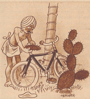
Der Fakir wechselt das Satteltkissen Le fakir change de coussin de selle

«Sie würden staunen! Das Kriegsschiff, das auf seiner Brust eintätowiert war, ist jetzt nur noch ein kleines Ruderboot.»