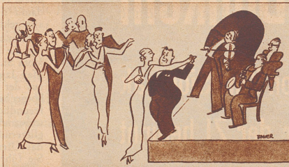
Der kleine Mann: «Ich finde die Musik einfach berauschend, mein Fräulein, könnten wir nicht immer in der Nähe des Podiums tanzen?»

— Vite! vite! cria le gamin entrant en courant chez le droguiste du village. Vite, mon père est poursuivi par un taureau! — Ciel! Que puis-je faire? s'enquit le droguiste. — Donnez-moi vite un nouveau film pour mon appareil photographique!