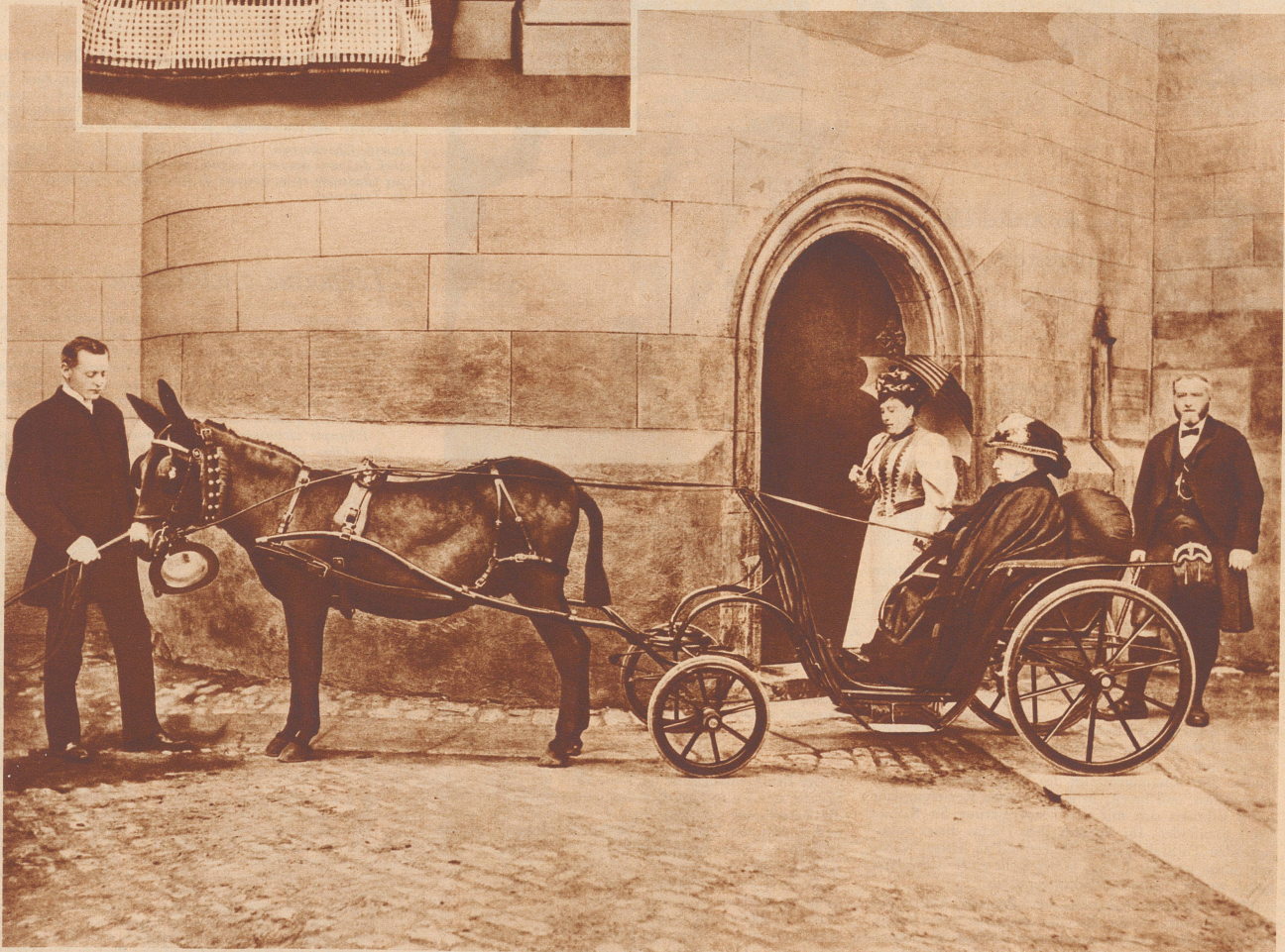
Die Königin bei der Ausfahrt

Sa Gracieuse Majesté la Reine Victoria et S. A. R. le Prince-consort Albert.