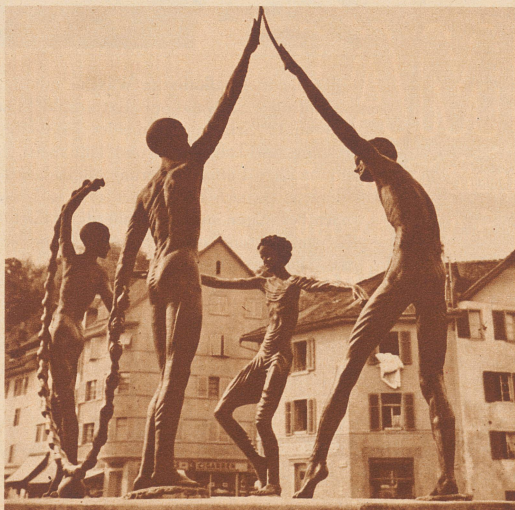
Der Gesundbrunnen. Eine der hübschesten, modernen Plastiken, die in Baden zu sehen sind. Er verkörpert die Heilwirkung der Quellen.

Wieviele wissen noch, daß das kleine Limmattädtchen Baden beinahe drei Jahrhunderte lang Bundeshauptstadt der alten Eidgenossenschaft war? Heute wirkt Baden auf den unbefangenen Besucher zunächst als Kleinstädtidyll und tatsächlich hat dieser Weltkurort und dieses Industriezentrum wirklich den ganzen Charme eines idyllischen Kleinstädtchens, wie Spitzweg, Richter oder Moritz von Schwind es in ihren Bildern und Zeichnungen schufen. Wenn man hoch über den roten Ziegeldächern der Altstadt auf den beschatteten Terrassen der Ruinen des alten Habsburgerschlosses steht und den Blick über die Wiesen und Wälder des Limmattales und der Lägern schweifen läßt, die zu nahen und weiten Wanderungen locken, kommt's einem auch wirklich nicht in den Sinn, daß da unten Kurbetrieb sein könnte, daß da in den gewaltigen Werkstätten der Brown Boveri AG. Hunderte und aber Hunderte von Arbeitern an der Werkbank stehen könnten, im Kampf um das tägliche Brot und zum Ruhme schweizerischer Arbeit. Denn in dieser kleinen Stadt der seltamen Dreieinigkeits von modernster Industriearbeit, heilsamen Naturkräften und alter Geschichte, herrschen zwei Dinge, die wir sonst überall missen, wo der moderne Mensch lebt: Ruhe und Behaglichkeit. Es ist, als ob die heilsamen Kräfte der Natur, die vielleicht seit Jahr-