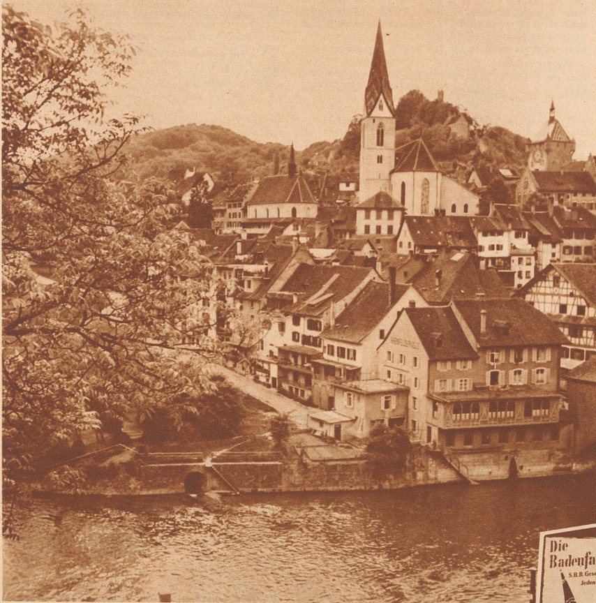
Blick auf Alt-Baden. Von der Limmat bis zu dem waldigen Hügel mit der Ruine des Habsburger-Schlusses ziehen sich die verwinkelten Gässchen Alt-Badens hin.

Erscheinen zwanglos in der «Zürcher Illustrierten» • Alle für die Redaktion bestimmten Sendungen sind zu richten an die «Geschäftsstelle des Wanderbunds», Zürich 4, am Hallwylplatz