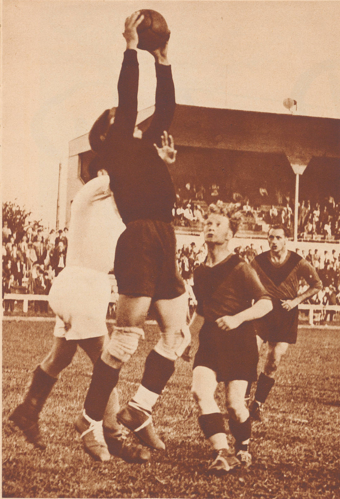
Spielmoment vor dem Tor der Young Fellows vom Match um den Mitropacup zwischen Young Fellows und Vienna am 27. Juni in Zürich. Dieses Spiel endigte 1:0 zugunsten der Young Fellows. Das dritte Mitropacupspiel Young Fellows-Vienna Dienstag den 29. Juni, auch in Zürich ausgetragen, gewann 2:0 Vienna.