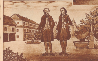
Der große, heute noch im unveränderten Original des Schinznacher Bades. Die große Halle à manger de Schinznach, das an s'est gardé de modifier le style.