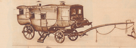
REISEWAGEN aus dem 17. Jahrhunderte für die Patienten des HOSPITALS BERN - nach dem BADE- SCHINZNACH...

Alter Stich aus dem Jahre 1702 von Johann Melchior Fischli. Die Gebäulichkeiten waren damals knapp zwei Jahre alt.