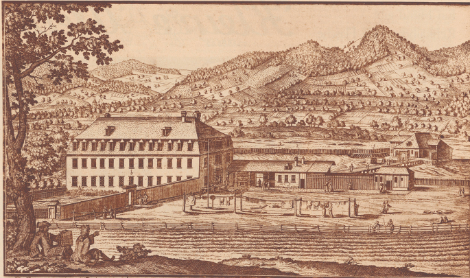
Sachliche Abbildung des Schinznacher Bades, wie solches samt dem Vorhaus schon seit Ansdelta...

Alter Stich aus dem Jahre 1702 von Johann Melchior Fischli. Die Gebäulichkeiten waren damals knapp zwei Jahre alt.