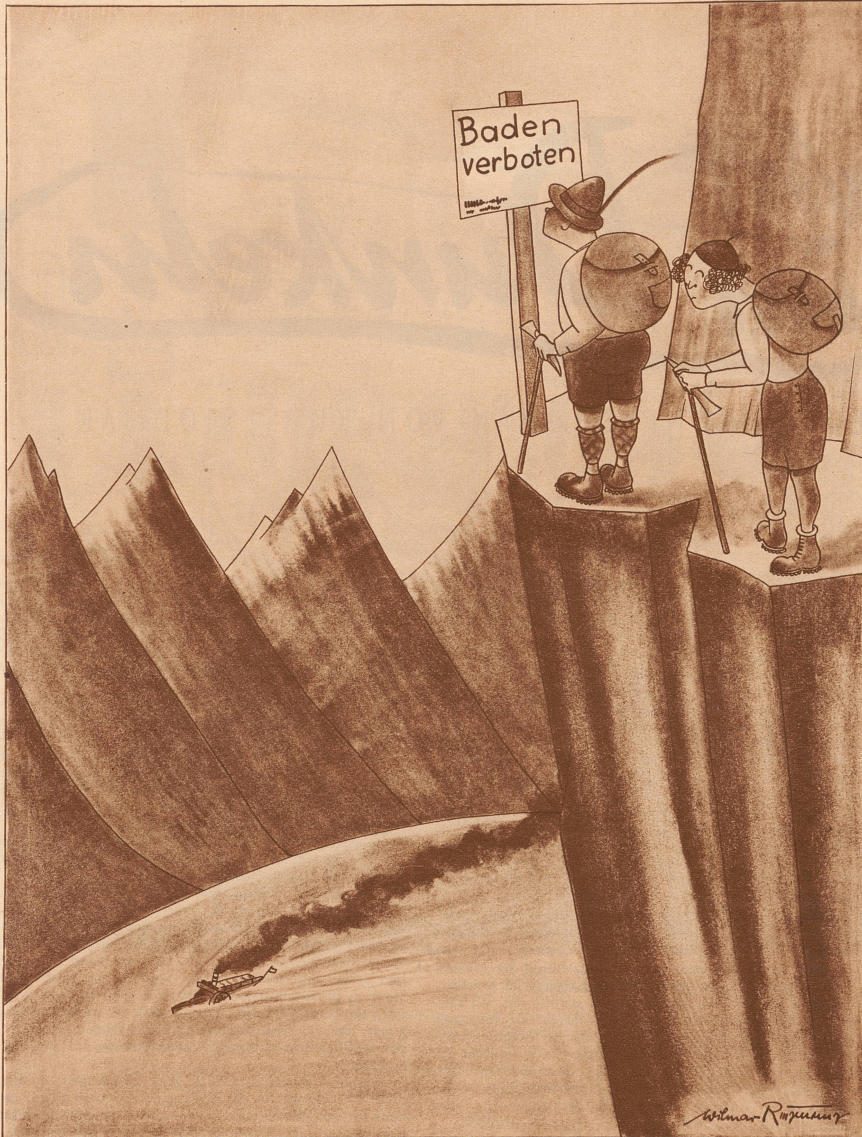
Baden verboten. — Défense de se baigner.