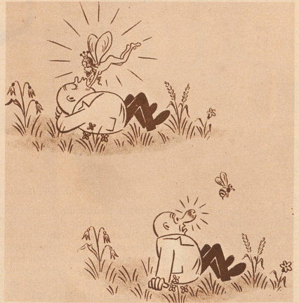
Ein feiner Traum.