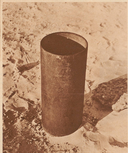
Das Rohr des heute völlig versiegten artesischen Brunnens von Sidi Rasched. Einsam steht es heute im gelben heißen Wüstensand, und in kurzer Zeit wird es unter einer Wanderdüne verschwunden sein.

Wenn zwischen zwei undurchlässigen Erdschichten Wassermengen liegen, die nach Anbohrung infolge des Ueberdrucks an die Oberfläche hinaufsteigen, so ist das ein artesischer Brunnen, so benannt nach der französischen Grafschaft Artois, wo dieses Verfahren zum erstenmal angewandt wurde. In dem zwischen Biskra und Touggourt in Algier zum Teil tiefer als