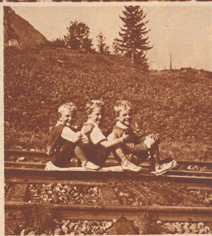
Die drei Buben rutschen sichtlich vernügt auf der Zahnrad-schiene nach Goldau.