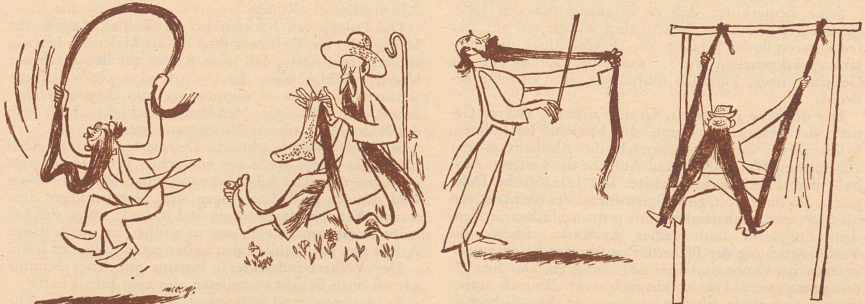
Neue Verwendungsmöglichkeiten für die langen Bärte. — Suggestions originales aux personnes barbues.